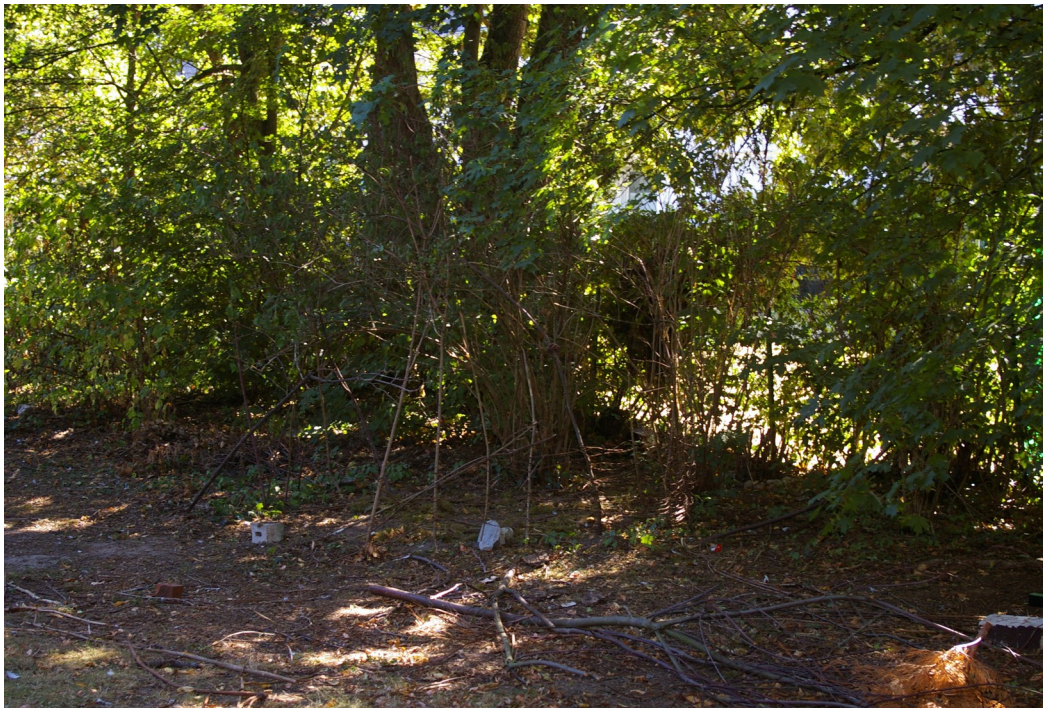
Abbildung 5: 6. Änderung, 2. Teilbereich - Aus Reisig gebautes Tipi