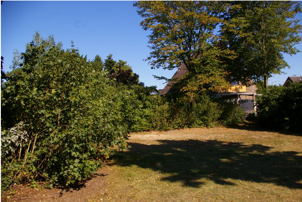
Abbildung 2: 6. Änderung, 1. Teilbereich - Grünland mit sandiger Fläche