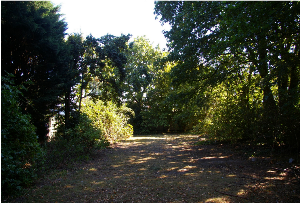
Abbildung 4: 6. Änderung, 2. Teilbereich - Schütteres Grünland mit umgrenzenden Gehölzen