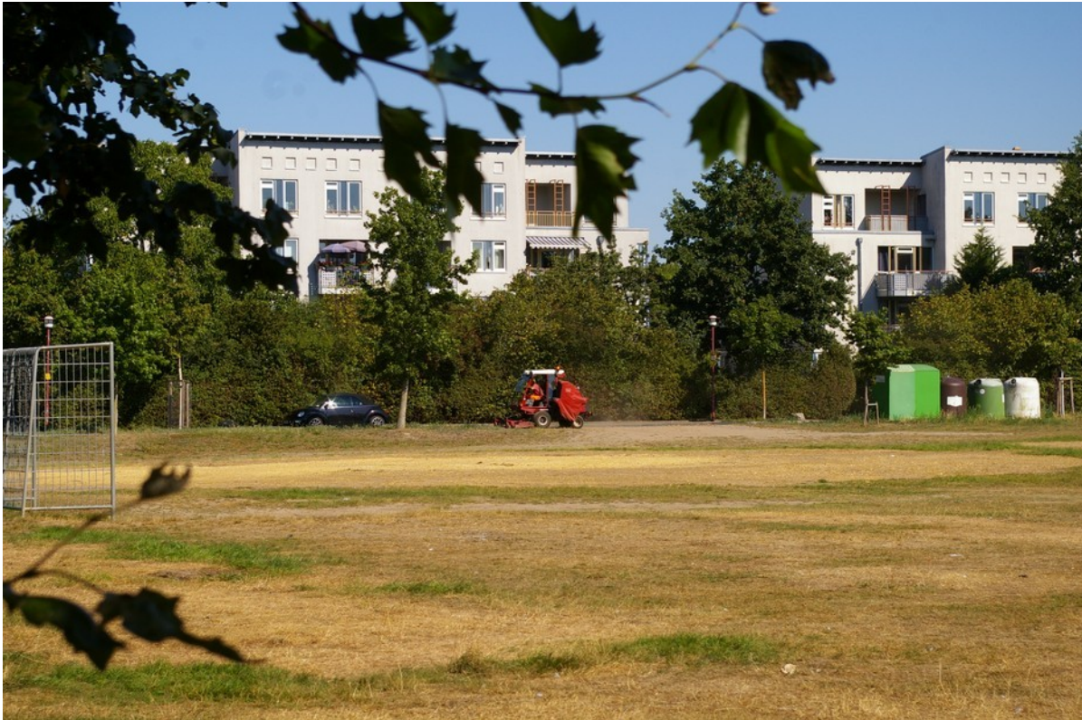
Abbildung 6: 7. Änderung - Junge Bäume entlang "Zu den Stationen" sowie Grünfläche mit Tor