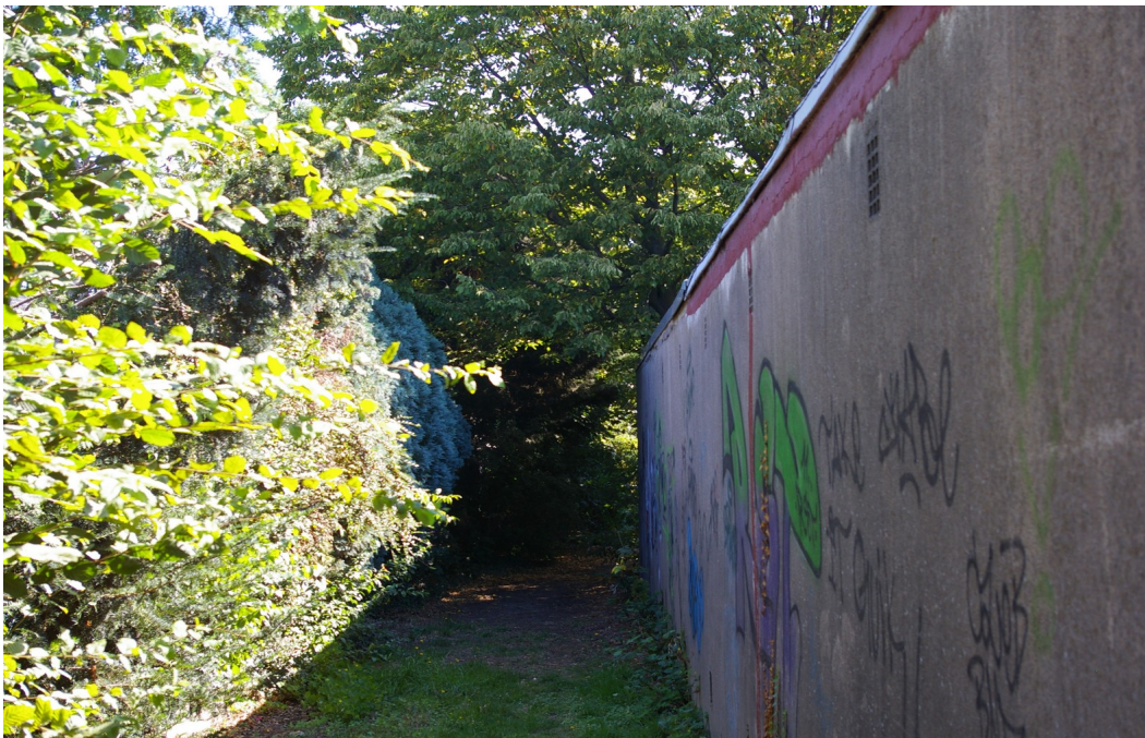
Abbildung 3: 6. Änderung, 2. Teilbereich - Zugang zur Fläche